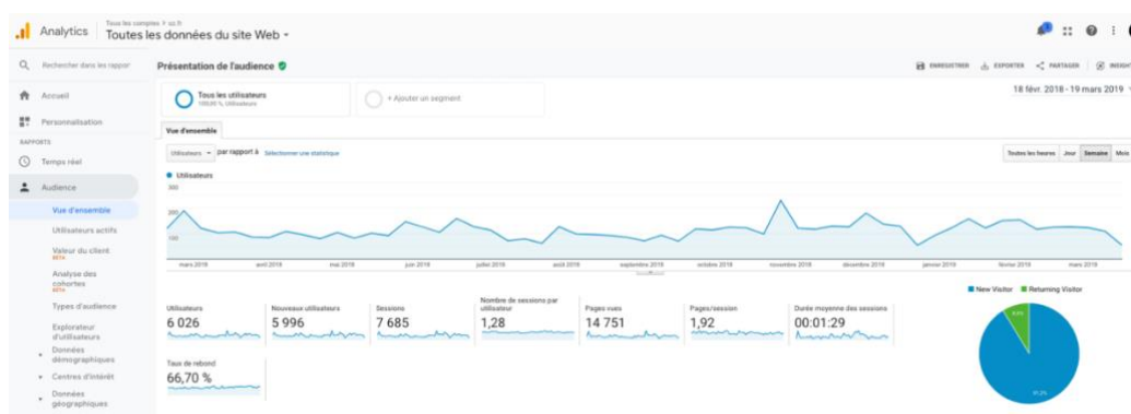
Vue des statistiques du site oz.fr sur Google Analytics

Les moteurs de recherche scannent régulièrement votre site à l'affut de mises à jour. Un site qui n'évolue pas voit son positionnement se dégrader au profit de sites avec du contenu plus récent. Il est donc conseillé de publier régulièrement.